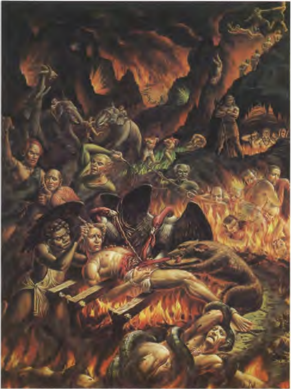
Wenn der sündhafte Mensch von den Schergen Yamarājas fortgeschleppt wird, zittert er vor Angst in ihren Händen, und es erwarten ihn schreckliche Qualen. (S. 561-566)