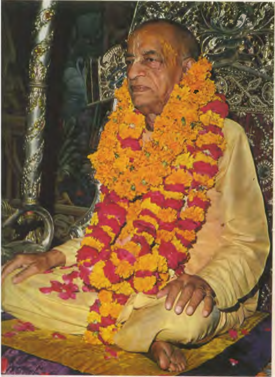
His Divine Grace A.C. Bhaktivedanta Swami Prabhupāda Gründer-Acārya der Internationalen Gesellschaft für Krishna-Bewußtsein