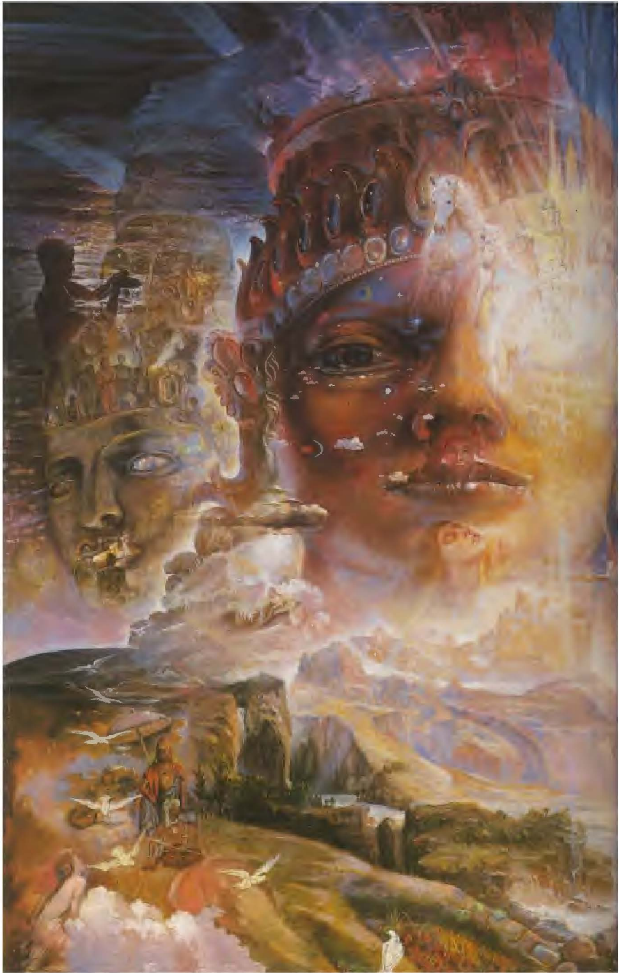
Die universale Form.