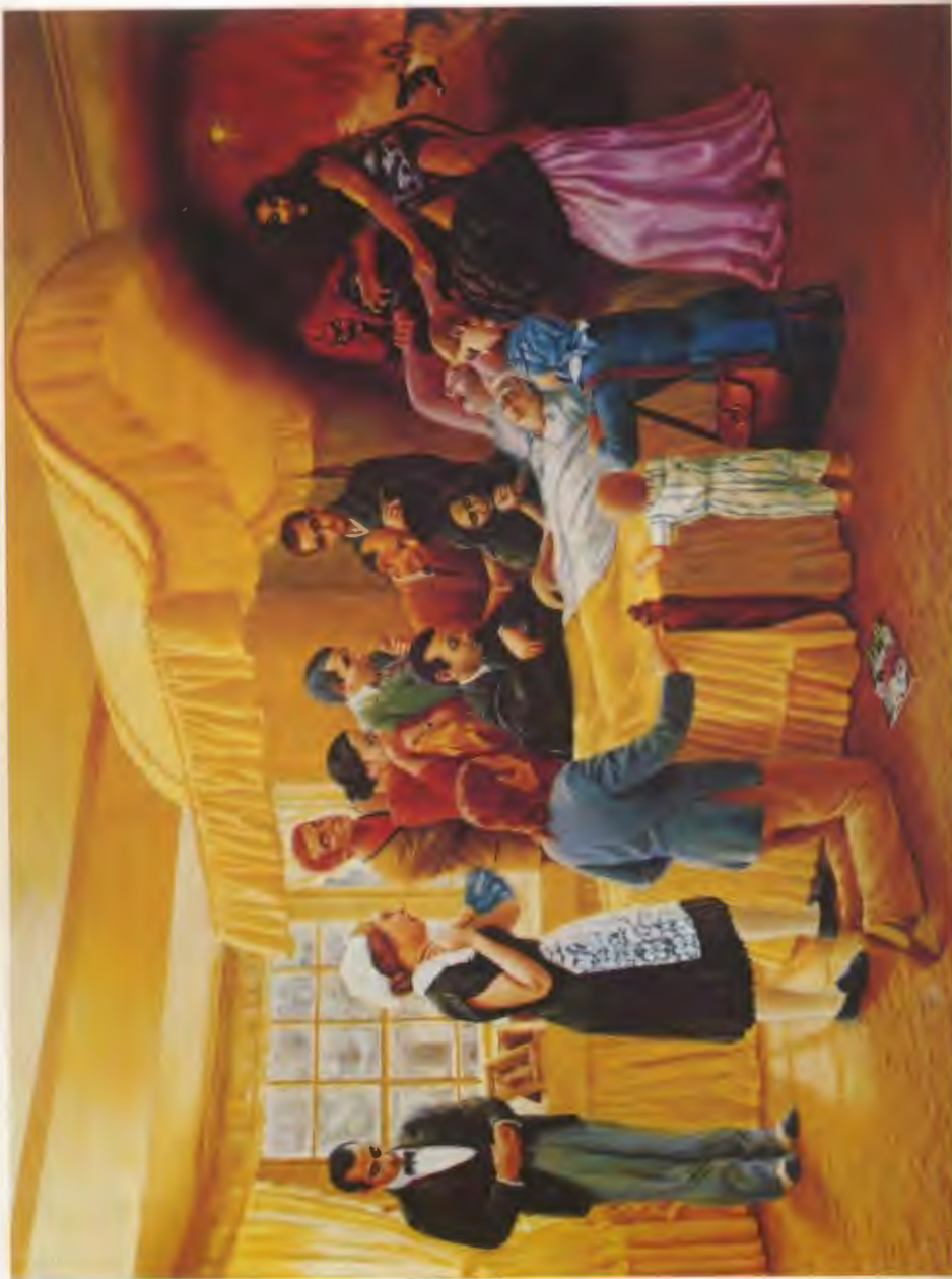
Die unangenehme Situation des angehafteten Materialisten im Sterbebett, umgeben von seinen trauernden Verwandten. (S. 558-561)