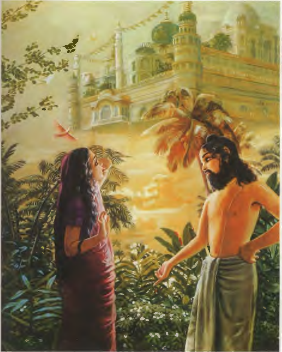
Da der Weise Kardama seine geliebte Frau erfreuen wollte, erschuf er mit Hilfe seiner yogischen Macht auf der Stelle einen Palast in der Luft, der nach seinem Willen reisen konnte (S. 215)